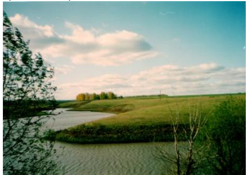
Пруд близ села Кузовлево

В приходе, состоящем из одного села, имеющем 86 дворов, в 1885 году числилось мужского пола 306 душ, женского пола 284 души. Весь состав населения с. Кузовлева делился на бывших государственных и временно обязанных крестьян. Первые жили зажиточно, последние – очень бедно.